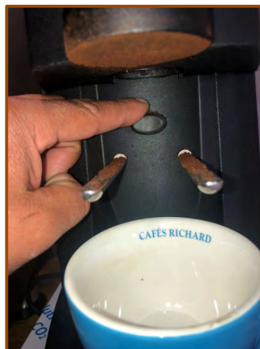
Appuyez sur l'interrupteur jusqu'à entendre le moulin tourner à vide