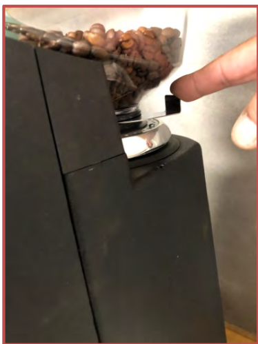
Fermez la trémie