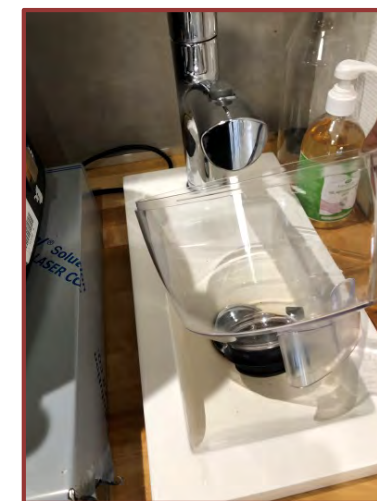
Nettoyez la trémie à l'eau chaude