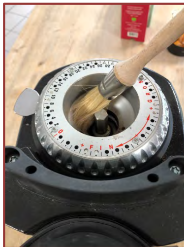
Nettoyez le support de meule avec un pinceau sec