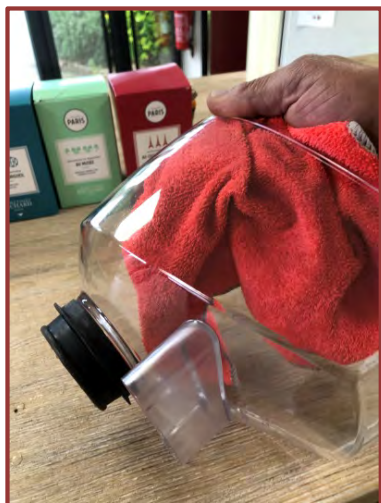
Séchez la trémie avec un torchon propre et sec