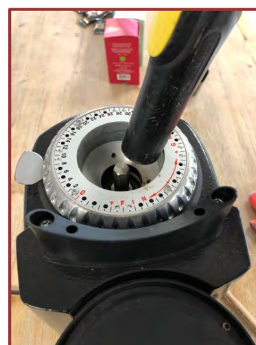
Aspirez le reste des résidus