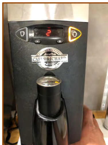
Lancez 3 doubles cafés au minimum puis les éliminer