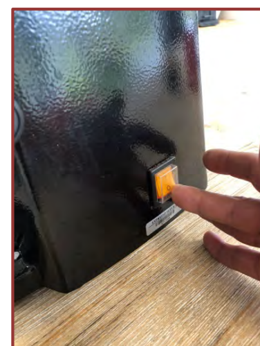
Mettez le moulin hors tension (sur 0)