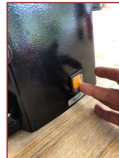
Mettez le moulin sous tension (sur 1)