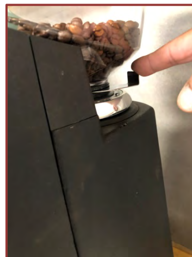
Ouvrez la trémie