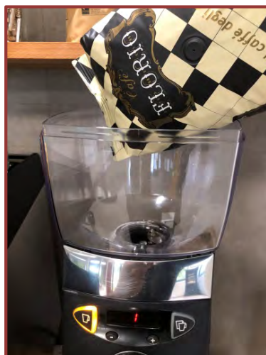
Remettez en place la trémie et la remplir (1 kg à la fois)