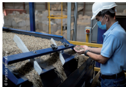
Traitement du café vert.